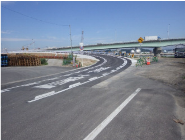
写真-1 終点側完成状況