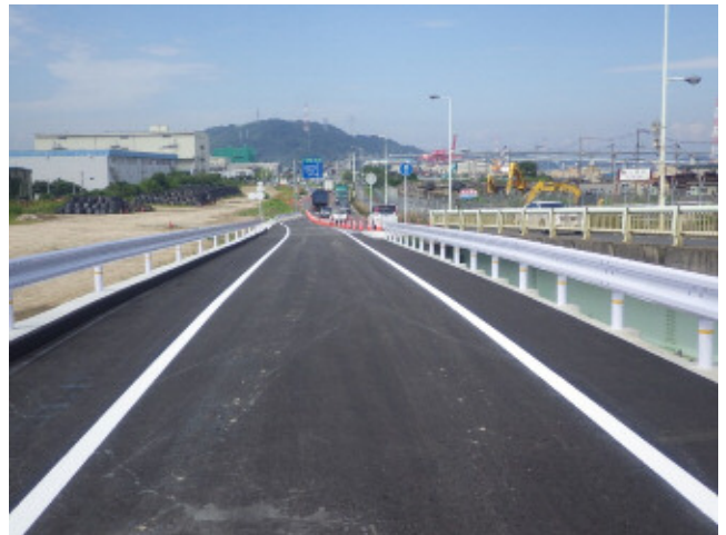
写真-2 起点側完成状況